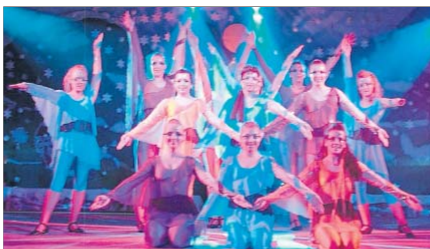
Die Prinzgarde erhielt viel Beifall für ihren Schautanz „Phantasie und Realität“.

Dass die Arbeit der KaGe Töpen auch im Kreise der großen fränkischen Fastnachtsfamilie ihre Anerken-