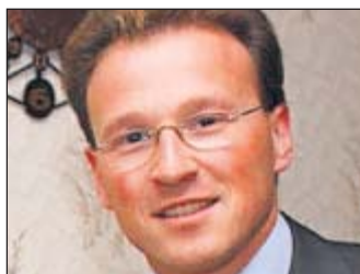
Alexander Eberl, Bürgermeister Schwarzenbach an der Saale

tovoltaik-Anlage auf dem Dach. Beim Großprojekt „Gewerkepark Winterling“ stehen wir kurz vor der ersten Baumaßnahme zur besseren Erschließung dieses Areals – für mich ein wichtiger Schritt. Interkommunal starten wir mit einem Klimaschutzprojekt und haben mit dem „Markt der Möglichkeiten“ den Bürgern unser Projekt „Generation 1-2-3“, das sich mit der Bewältigung des demographischen Wandels beschäftigt, näher bringen kön-